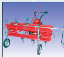
Bandheuer 125 cm