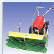
Kehrmaschine 100 cm mit/o. Auffangbehälter balayeuse 100 cm avec/ sans bac de ramassage