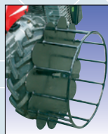
Gitterrad mit Schnellkupplung roue-grille à montage rapide