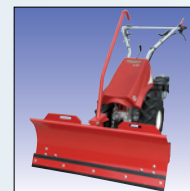
Schneeräumschild 100 cm chasse-neige 100 cm