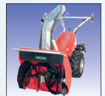
Schneefräse 60 cm fraise à neige 60 cm